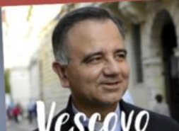
Vescovo Erio Reale

ORE 16:30 TEATRO SCUOLE "FIGLIE DI GESÙ"